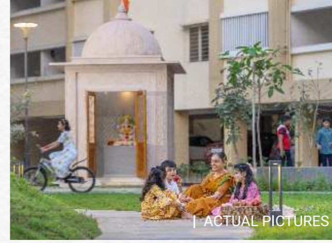
| ACTUAL PICTURES