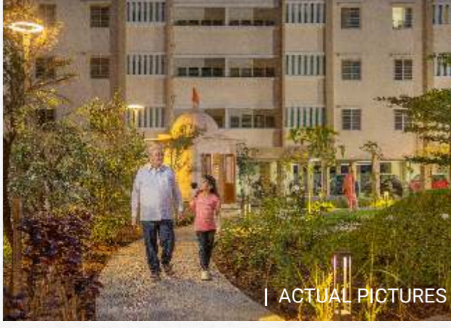
| ACTUAL PICTURES