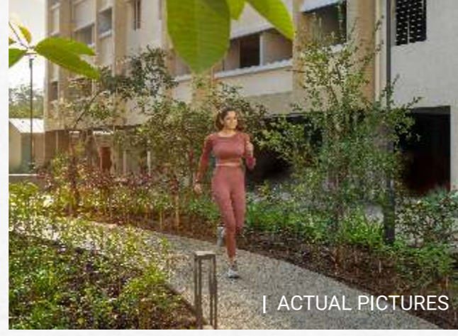
| ACTUAL PICTURES