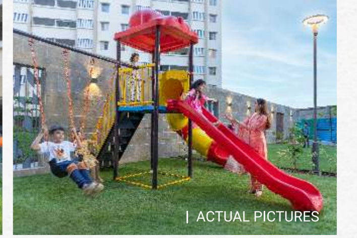
| ACTUAL PICTURES