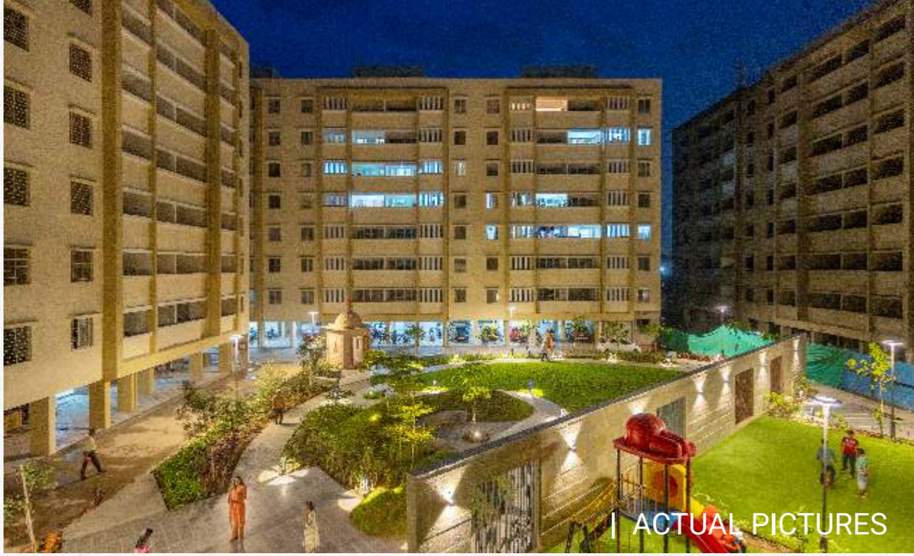
| ACTUAL PICTURES