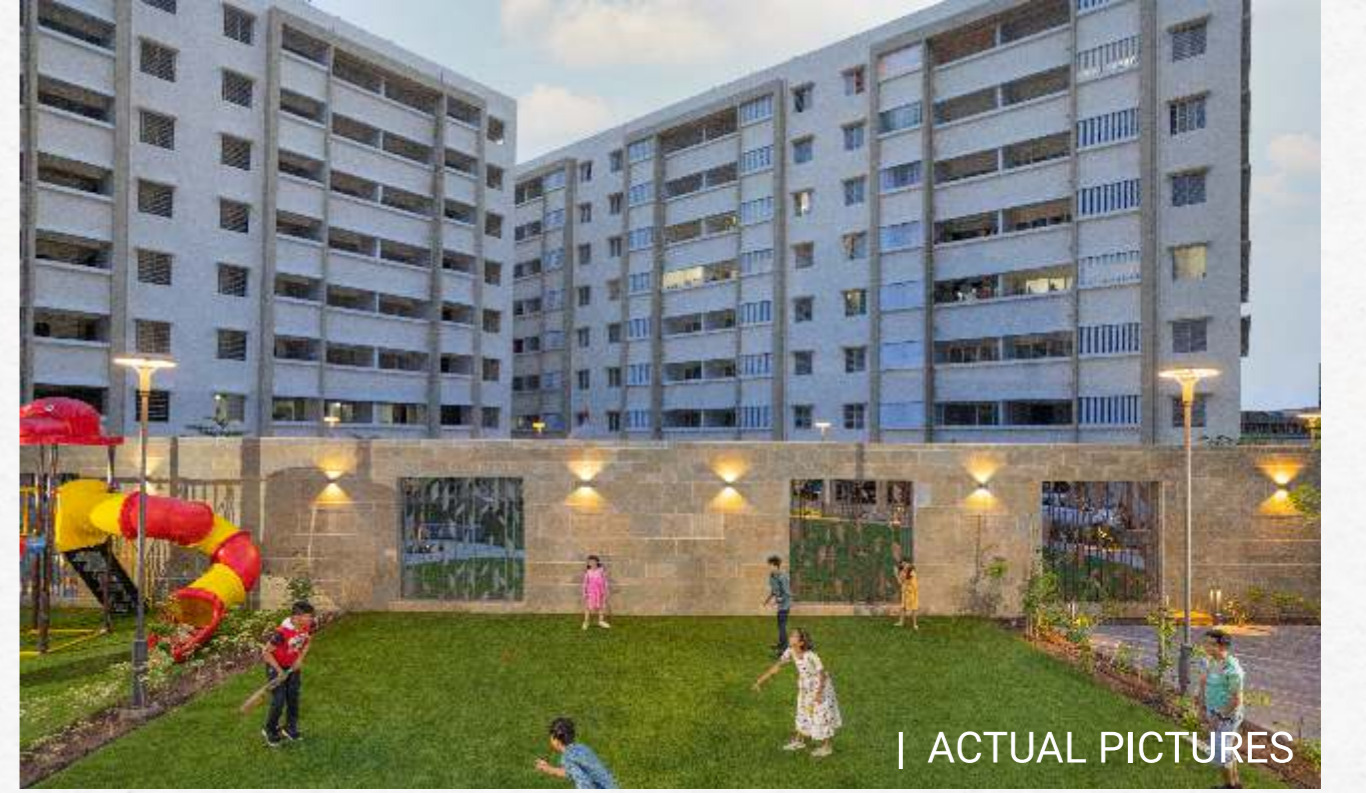
| ACTUAL PICTURES