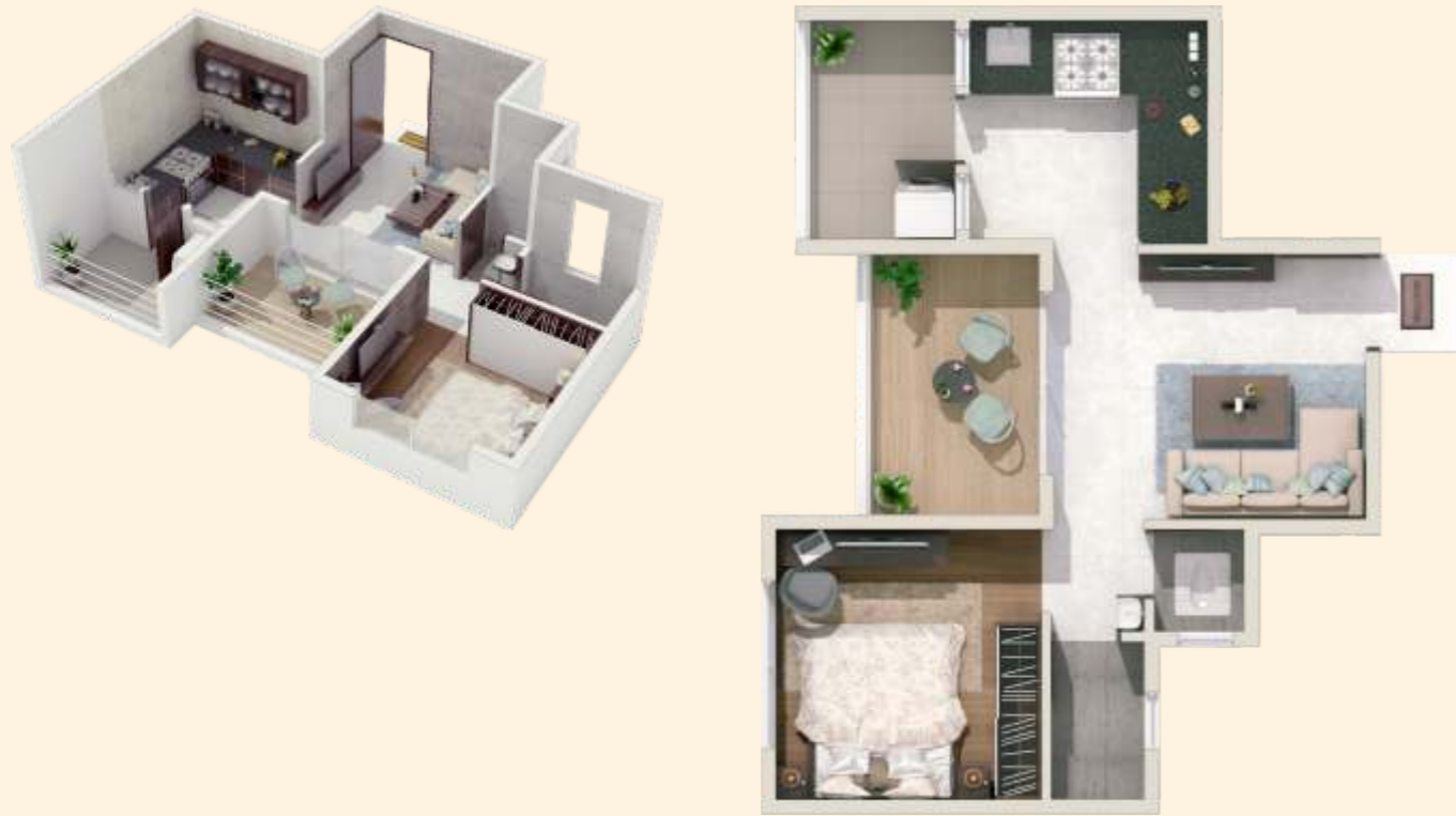
1 BHK (Type 1)