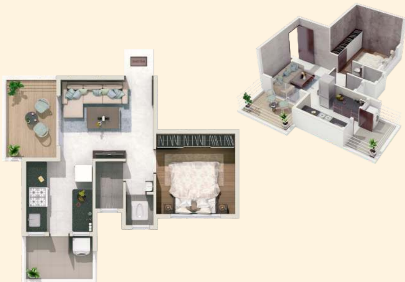
1 BHK (Type 2)