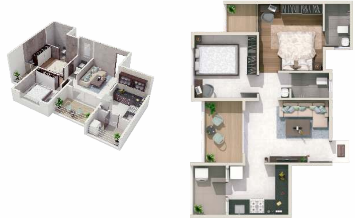
2 BHK (Type 1)