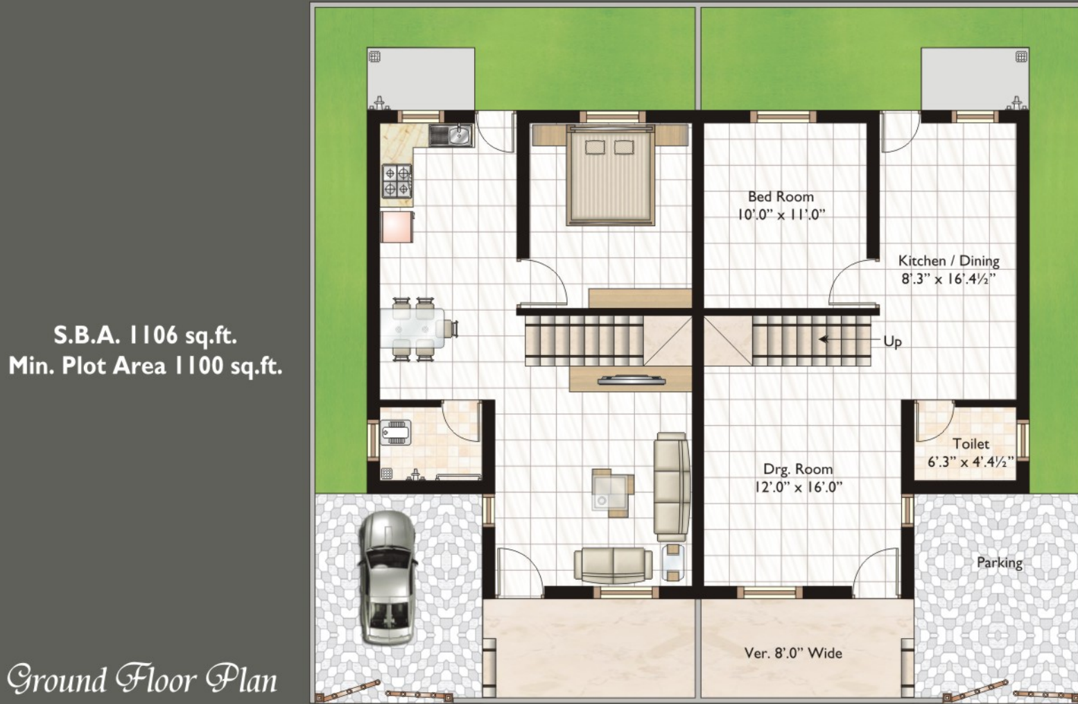
Ground Floor Plan