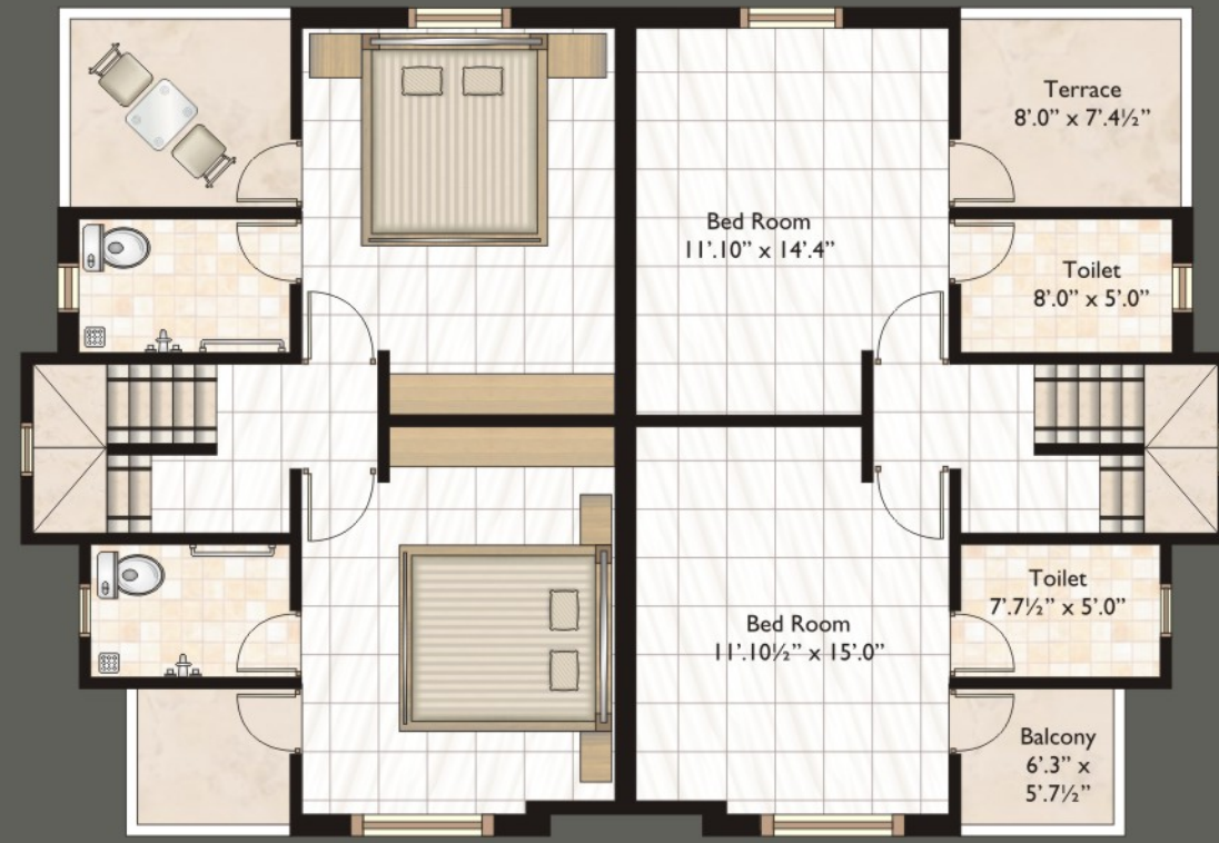
First Floor Plan