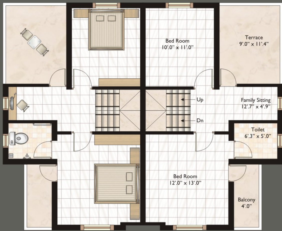
First Floor Plan