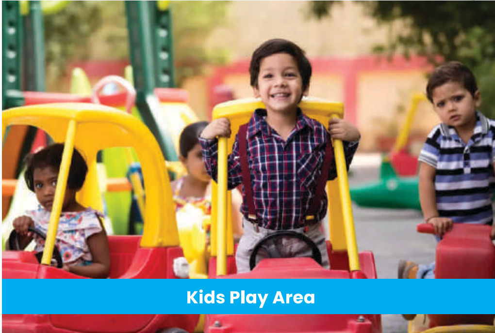
Kids Play Area